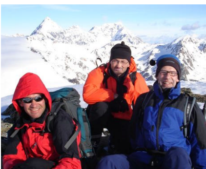
Auf dem Gipfelchen