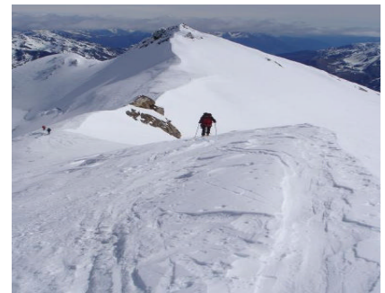
Blick zurück zur Zufallspitze

Zum Glück hat sich zwischenzeitlich der Wind gelegt und wir können gemütlich auf dem Gipfel (3769 m) sitzen. Die Variante des Übergangs zur Zufallspitze (leicht machbar) wird verworfen, wir haben ja noch zwei Tourentage. Also Abfahrt über die Aufstiegsroute. Bis auf 3400m herab ist der Schnee ziemlich fest. Weiter unten dann ist der flache Gletscher traumhaft aufgefirt. Es fährt sich wie auf Wasserski und der wegfließende Firn macht ein Geräusch wie ein ganzer Haufen australischer Regenmacher. Bis zur Hütte kann man bei idealen Schneeverhältnissen fahren und wir sind kurz vor mittag zurück.