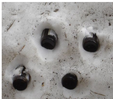
Ergebnis der Versorgungsfahrt

Nachmittags unternimmt Luc dann den Versorgungsgang runter zur Zufallhütte. Für den morgigen Tag ist vormittags eine heranziehende Kaltfront angesagt. Wenn das Zwischenhoch für gute Verhältnisse sorgt und sich die Kaltfront etwas Zeit lässt wollen wir noch einmal einen Versuch auf die Zufallspitze machen.