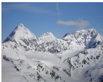
Königsspitze, Monte Zebur und Ortler

Um 8 Uhr sind wir wieder an der Hütte. Gepackt und saubergemacht ist schnell und wir fahren bis zum Gletscherlehrpfad ab. Dort heisst dann die Ski schultern und auf der Zufallhütte gibt's noch einen Kaffee. Schnell sind wir am Parkplatz und schon vor 11 Uhr fahren wir los. Der Himmel bewölkt sich inzwischen, die Kaltfront ist im Anmarsch und im Norden fängts dann richtig an zu schütten.. Die Rückfahrt ist leider nicht so schön, wir kommen an zwei schweren Verkehrsunfällen mit insgesamt 4 Rettungshubschraubern vorbei.