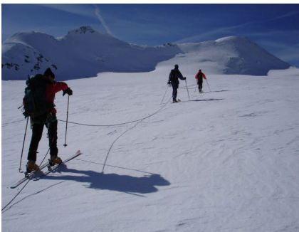
Letztes Stück Richtung Cevedale

Morgens um halb fünf sind nur einige Wolkenreste übrig, nur der Wind bläst noch ziemlich stark. Nach spartanischem Frühstück sind wir um 5 Uhr aus der Hütte. Das ist auch ganz gut so, denn die Sonne geht schon sehr früh auf. Wir können von der Hütte (2610m) ab mit Ski gehen, der Schnee ist über Nacht durch gefroren. Der übliche Aufstieg geht über den flachen und augenscheinlich spaltenarmen Zufallgletscher weit nach Nordwesten ausholend – ein bisschen eintönig ist es ja schon. So ähnlich wie das Strahlhorn halt. Erst die nordwestlich ausgerichtete Gipfelflanke bringt etwas Abwechslung. Oft ist der letzte Aufschwung nur mit Steigeisen zu gehen, diesmal liegt noch viel Schnee und sogar die Harscheisen können im Rucksack bleiben.