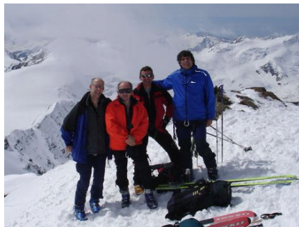
Auf dem Cevedale