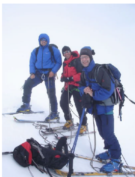
Auf dem "Skigipfel"